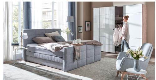
Bei den abgebildeten Produkten handelt es sich um Wohnbeispiele.